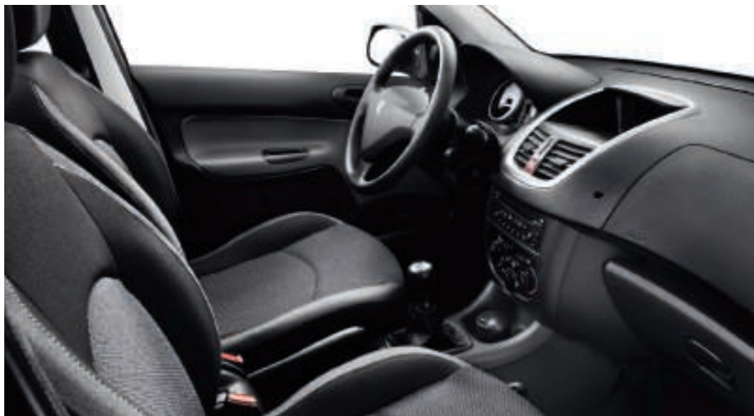
Polster: Stoff Pacifico Schwarz/Blau

Der PEUGEOT 206+ ist in vier Metalliclackierungen und drei Normalfarben erhältlich, die alle sehr gut mit dem Innenraumdesign harmonisieren**.