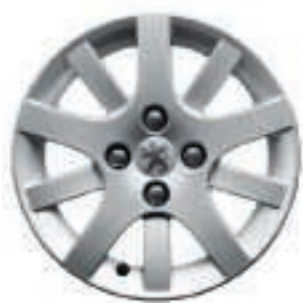
Leichtmetallfelgen Interlagos 15**