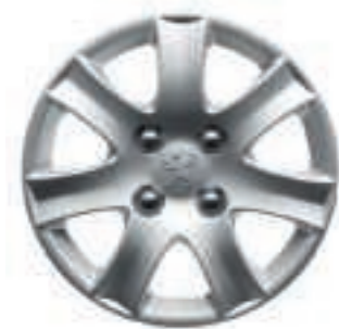
Radzierblenden Spa 14*