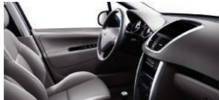
Optional: Leder* (perforiert) Graubeige

*LederAusstattung: Vordersitze: Kopfstütze, oberer Teil der Rückenlehne (Vorderseite), Innen- und Außenseite der Seiten- und Schenkelstützen sowie Vorderseite des Sitzkissens aus Leder. Oberseite des Sitzkissens sowie mittlerer und unterer Bereich der Rückenlehne aus perforiertem Leder. Rückbank: Vorderseite der Kopfstütze, oberer Teil der Rückenlehne (Vorderseite), Innenseiten der Seiten- und Schenkelstützen, Vorderseite der Rückenlehne (Mittelteil) und Oberseite des Sitzpolsters (Mittelteil) sowie Vorderseite der Sitzfläche (Rücksitzbank) aus Leder. Oberseite des Sitzkissens (Seitenplätze) sowie mittlerer und unterer Bereich der Rückenlehne (Seitenplätze) aus perforiertem Leder.