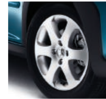
Leichtmetallfelgen Outdoor 16"