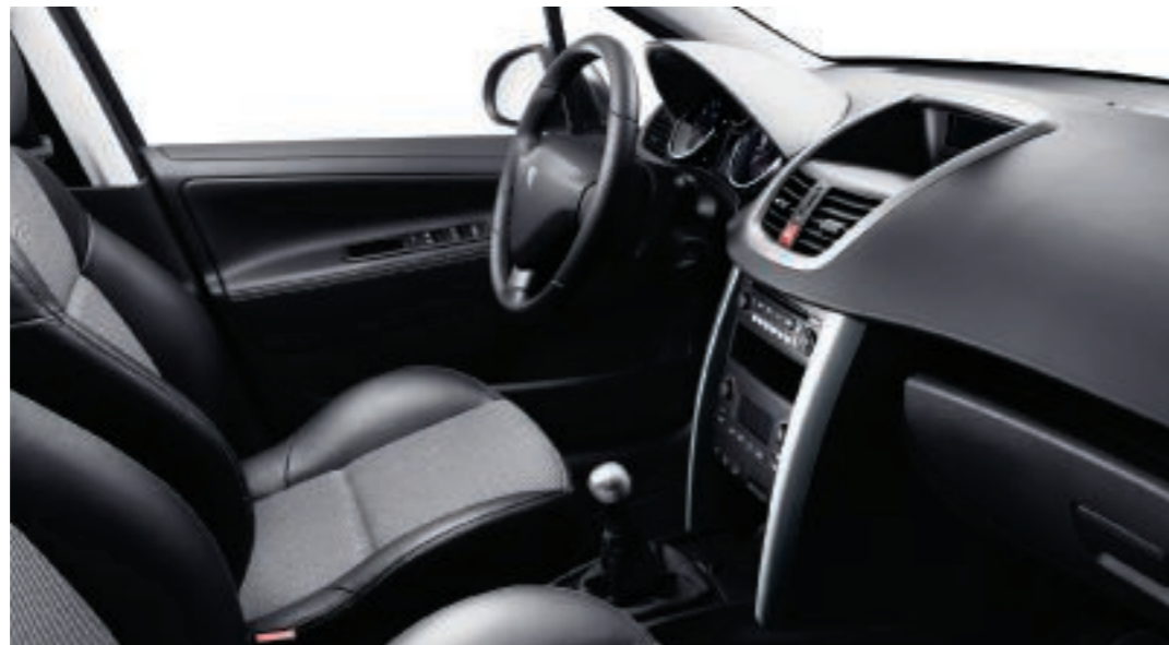
Polster: Stoff/Leder* Pawerne Graubeige/Schwarz

*Stoff-/LederAusstattung: Vordersitze: Kopfstütze, Innenseite der Seiten- und Schenkelstützen sowie Außenseite der Seitenstützen aus Leder. Rückbank: Vorderseite der Kopfstütze, Innenseite der Seiten- und Schenkelstützen, Vorderseite der Rückenlehne (Mittelteil) sowie Oberseite des Sitzpolsters (Mittelteil) aus Leder.