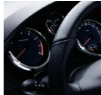
Schwarz hinterlegte Rundinstrumente mit Chromumrandung