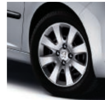
Radzierblenden Hobart 15"