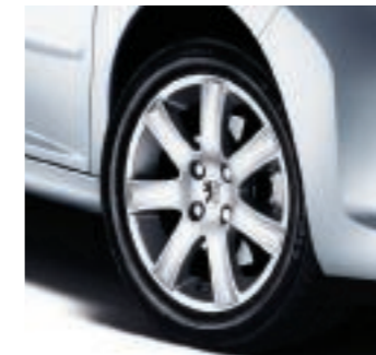
Leichtmetallfelgen Spa 16"