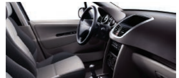
Polster: Stoff Pachinko Graubeige