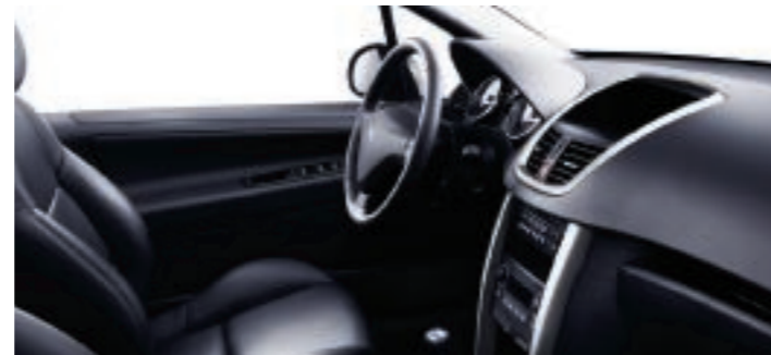
Optional: Leder* (perforiert) Schwarz