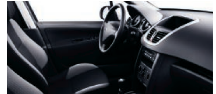
Polster: Stoff Pachinko Schwarz