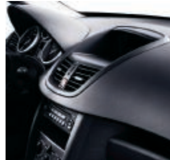
Dekorelemente in Shadow Anthrazit