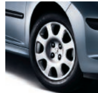
Radzierblenden Auckland 15"

*Die Angaben wurden ermittelt nach den vorgeschriebenen Messverfahren (RL 80/1268/EWG) in der gegenwärtig gültigen Fassung. ( ) Werte für das Modell 207 SW Escapade.