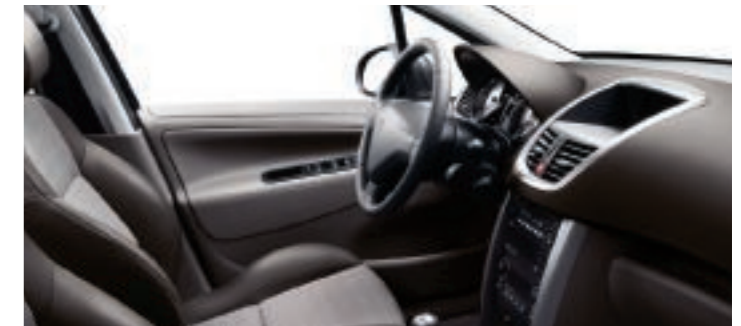
Polster: Stoff/Kunstleder* Melila Graubeige/Criollo