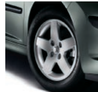
Leichtmetallfelgen Monaco 15"