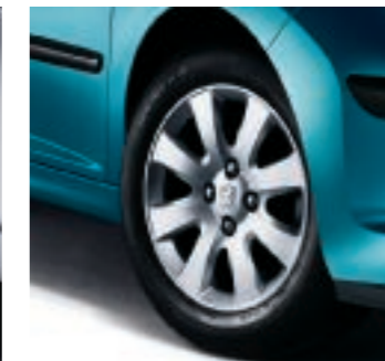
Radzierblenden Perth 16"