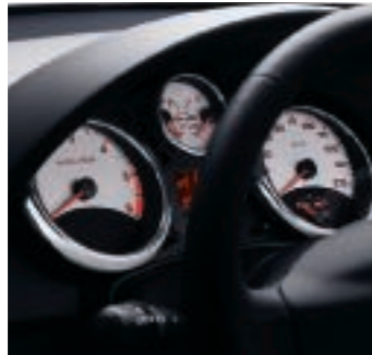
Weiß hinterlegte Rundinstrumente mit Chromumrandung