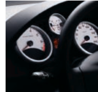
Weiß hinterlegte Rundinstrumente mit grauer Umrandung