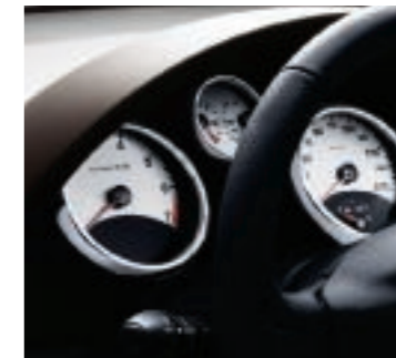
Weiß hinterlegte Rundinstrumente mit Chromumrandung