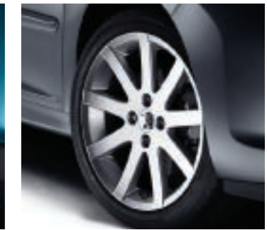
Leichtmetallfelgen Pitlane 17"