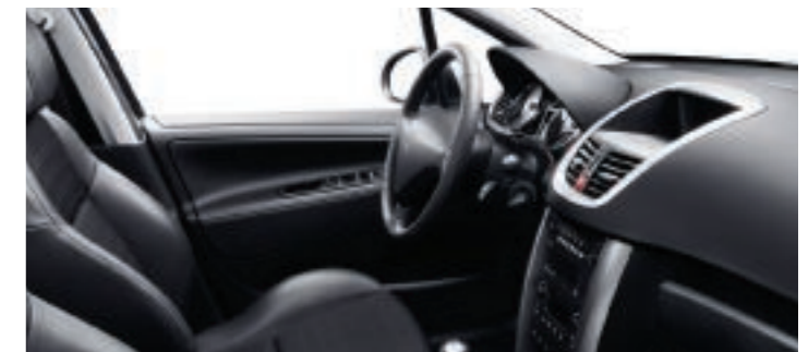
Polster: Stoff/Kunstleder* Melila Schwarz

*Stoff-/Kunstlederausstattung: Vordersitze: Kopfstütze, Innenseite der Seiten- und Schenkelstützen sowie Außenseite der Seitenstützen aus Kunstleder. Rückbank: Vorderseite der Kopfstütze, Innenseite der Seiten- und Schenkelstützen, Vorderseite der Rückenlehne (Mittelteil) sowie Oberseite des Sitzpolsters (Mittelteil) aus Kunstleder.