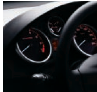
Schwarz hinterlegte Rundinstrumente mit grauer Umrandung