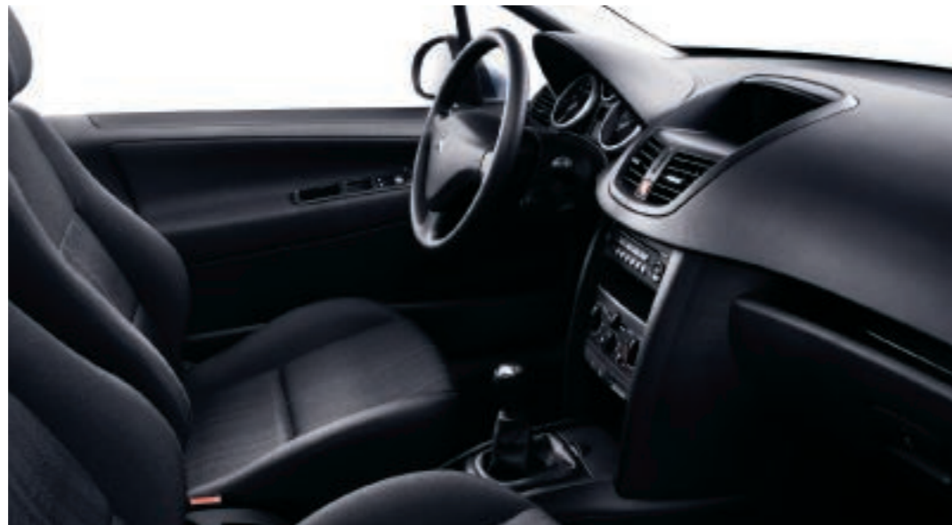
Polster: Stoff Koulikoro Schwarz