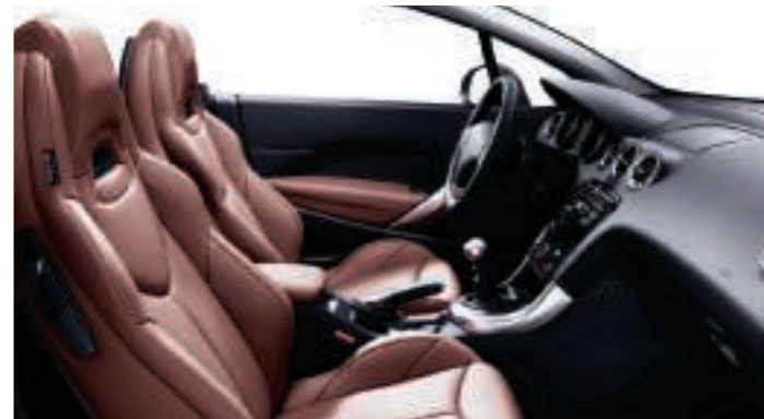
Polster: Leder* Vintage Bordeaux Rot (perforiert)