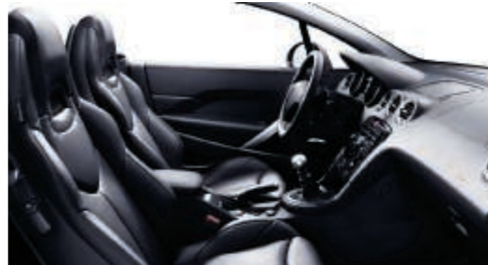
Polster: Vollederausstattung** Mistral Schwarz