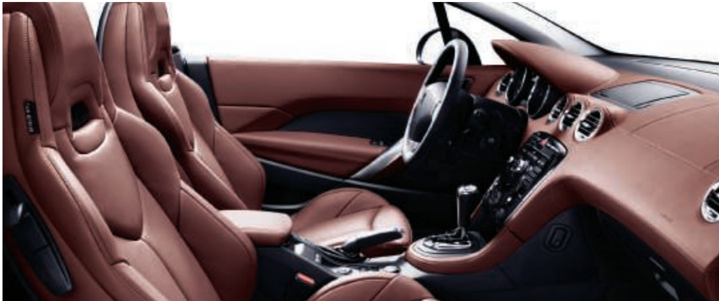
Polster: Vollederausstattung** Vintage Bordeaux Rot (perforiert)