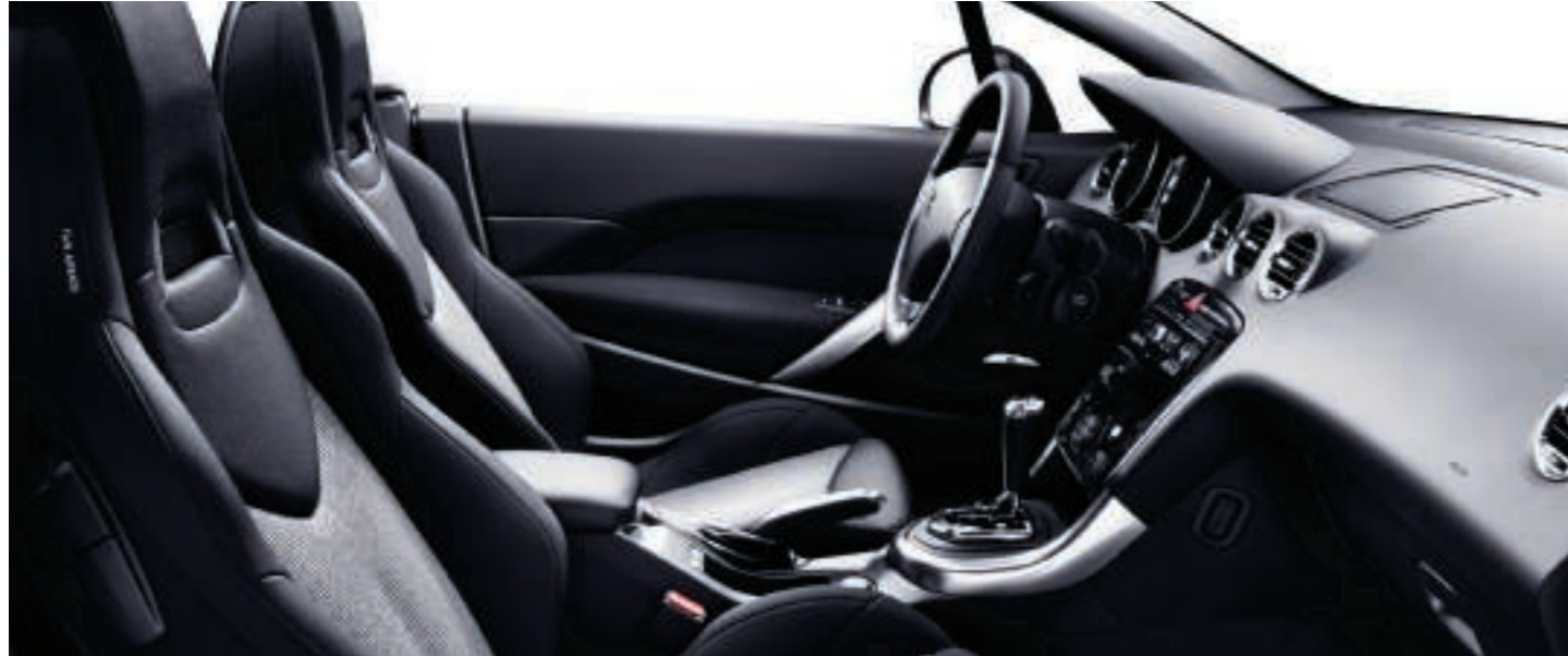
Polster: Stoff Speed Up Anthrazit