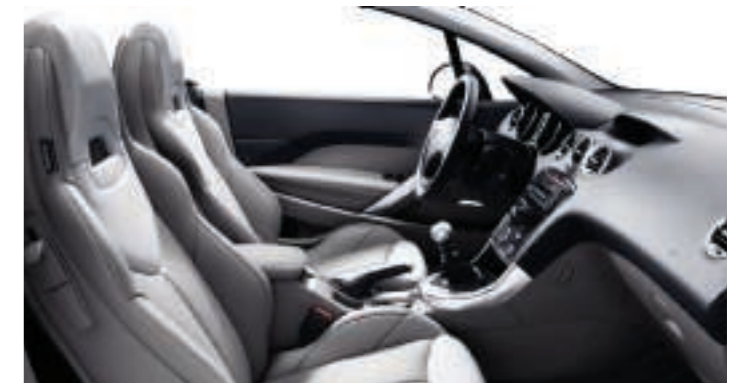
Polster: Leder* Graubeige/Lama Grau

*Die Lederausstattung des 308 CC im Detail: Vordersitze: Sitzfläche und Vorderseite der Rückenlehne, Innenseiten der Seiten- und Schenkelstützen aus Leder. Rückbank: Sitzfläche und Vorderseite der Rückenlehne, Seiten- und Schenkelstützen aus Leder. **Die Vollederausstattung entspricht der Lederausstattung mit zusätzlich: Lederbezogenen Teilen der Türverkleidung, einem Armaturentafelbezug aus Leder sowie einer U-förmigen Schalthebeleinfassung aus Leder.