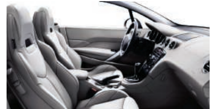
Polster: Vollederausstattung** Graubeige/Lama Grau