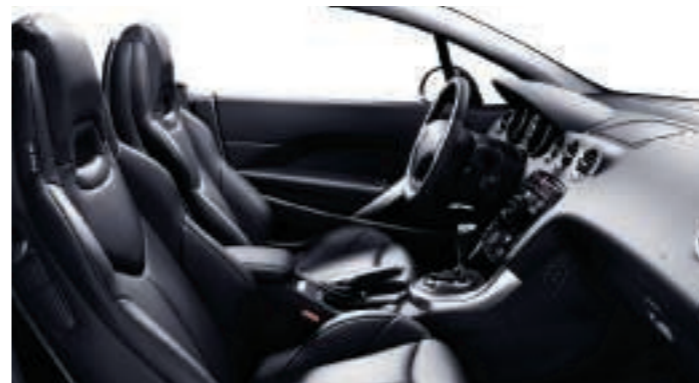
Polster: Leder* Mistral Schwarz

*Die Lederausstattung des 308 CC im Detail: Vordersitze: Sitzfläche und Vorderseite der Rückenlehne, Innenseiten der Seiten- und Schenkelstützen aus Leder. Rückbank: Sitzfläche und Vorderseite der Rückenlehne, Seiten- und Schenkelstützen aus Leder. **Die Vollederausstattung entspricht der Lederausstattung mit zusätzlich: Lederbezogenen Teilen der Türverkleidung, einem Armaturentafelbezug aus Leder sowie einer U-förmigen Schalthebeleinfassung aus Leder.