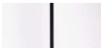
Antarktis Weiß (Normalfarbe)