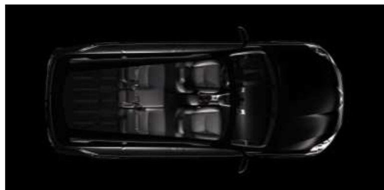
Konfiguration mit fünf Sitzplätzen.