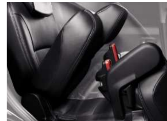
Die Sitze in Reihe 2 lassen sich verschieben, neigen und umlegen.