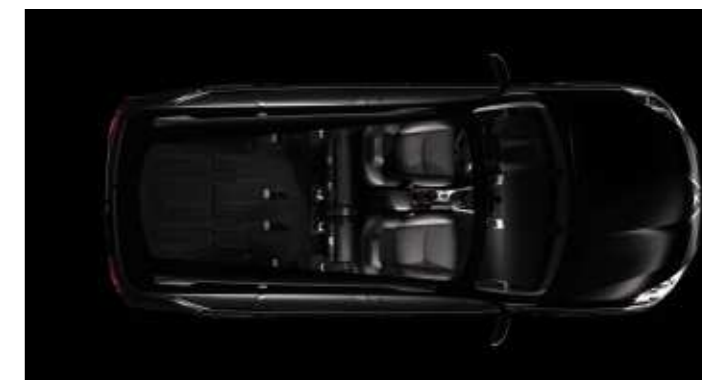
Konfiguration mit zwei Sitzplätzen.