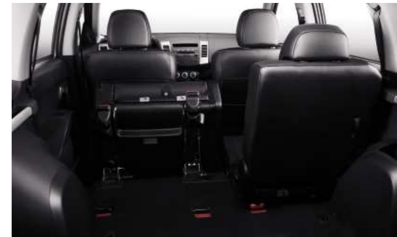
Elektrisch umklappbare Plätze in der zweiten Sitzreihe.

Für Abstecher ins Gelände ist mit viel Platz für Gepäck ebenfalls vorgesorgt. Dazu lassen sich die Sitze in der zweiten Reihe asymmetrisch (60:40) elektrisch umklappen und um 80 mm der Länge nach verschieben. Der Kofferraum birgt eine ausklappbare Sitzbank, die zwei weiteren Personen Platz bietet.