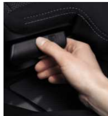
Mit einem Griff lassen sich die Sitze in Reihe 2 umlegen.

Hinter der zweiten Sitzreihe steht Ihnen ein außergewöhnliches Kofferraumvolumen zur Verfügung. Es beträgt bei Verwendung der Gepäckraumabdeckung zwischen 441 und 510 l. Bei umgeklappten Sitzen erreicht das Ladevolumen des 4007 1.686 l nach VDA-Norm.