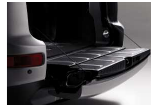
Die untere umklappbare Heckklappe macht das Be- und Entladen sehr viel einfacher.