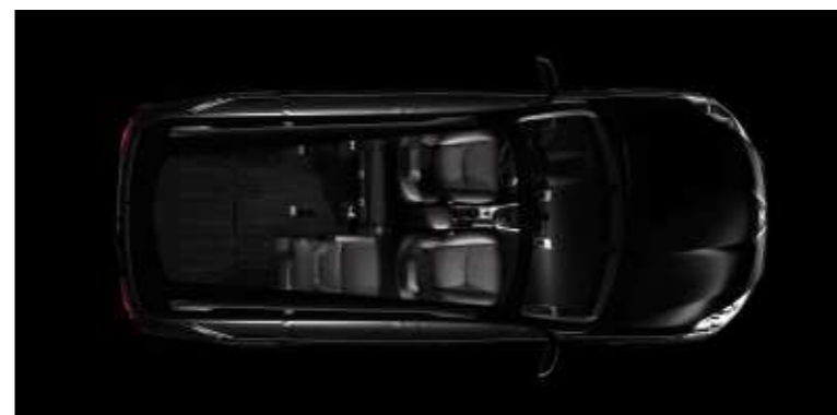
Konfiguration mit drei Sitzplätzen.