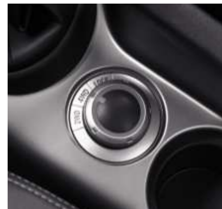
Manueller Drehschalter zur Wahl des Antriebsmodus.

Bei Schnee, Sand, Matsch, kurzum schwierigeren Bedingungen, aktivieren Sie einfach den „4WD Lock“-Modus. Im Vergleich zum Automatikmodus leitet das System dann bis zu anderthalbmal so viel Drehmoment auf die Hinterräder und hilft Ihnen dabei, die Herausforderungen zu überwinden.