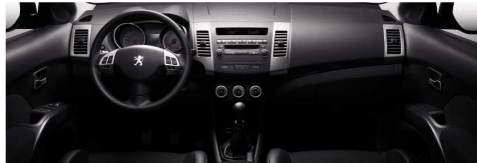
Interieur 4007 Sport.