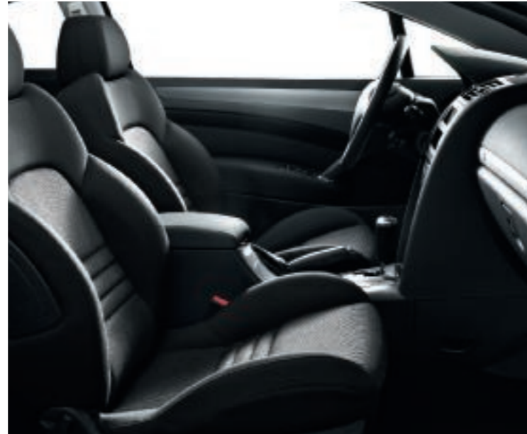
Polster: Stoff Speed´ Up Schwarz

Als Ausstattungen erhältlich: Stoff/Leder Speed´ Up Schwarz sowie optional Lederausstattungen.