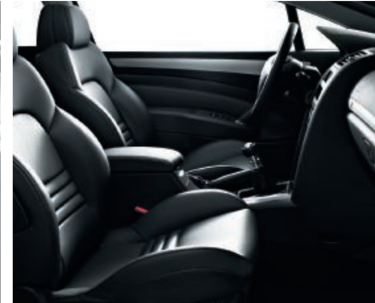
Polster: Leder* Mistral Schwarz