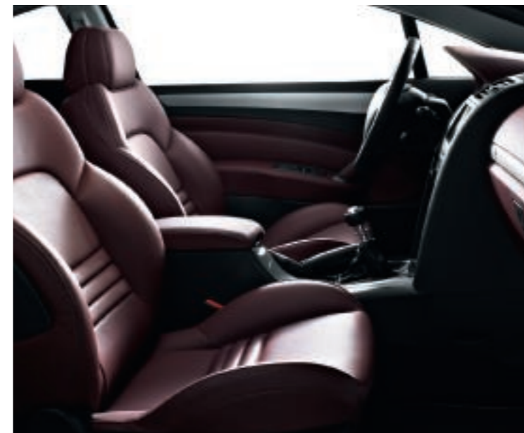
Polster: Leder* Zerberus Rot (Abb. mit Volllederausstattung**)

*Lederausstattung: Mit Leder bezogen sind die Vorderseiten der Rückenlehnen und die Sitzflächen der Vordersitze, die Kopfstützen vorn, ein Teil der Türverkleidung sowie die Sitzfläche und die Vorderseite der Rückenlehne der Rückbank, die hintere Mittelarmlehne sowie die hinteren Kopfstützen.