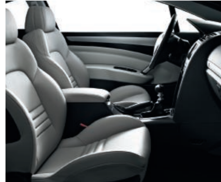
Polster: Leder* Lama Hellgrau (Abb. mit Volllederausstattung**)