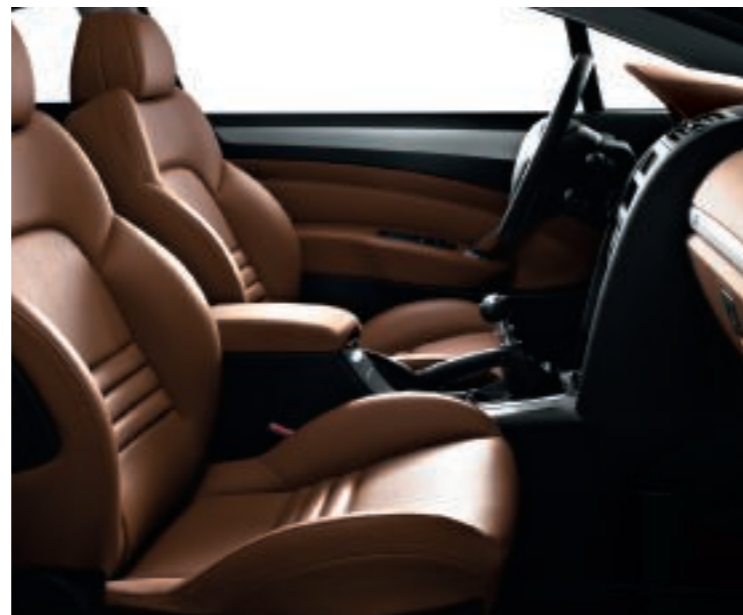
Polster: Leder* Palimbro Braun (Abb. mit Volllederausstattung**)