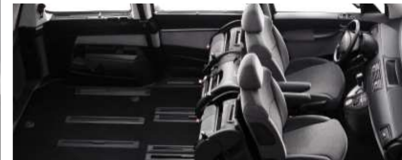
In der „Cargo“-Position werden die Rücksitze komplett zusammengeklappt, um den Zugang zur 3. Sitzreihe zu erleichtern oder maximalen Gepäckraum zu schaffen.