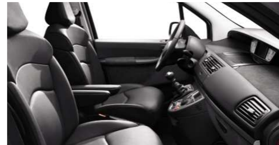
Polster: Leder* Mistral Schwarz

*Leder ausstattung: Vorn: Oberseite der Sitzfläche, Vorderseite der Rückenlehnen, Vorderseite und Seitenteile der Sitzfläche, Vorderseite der Kopfstütze, Innenflächen der seitlichen Verlängerungen der