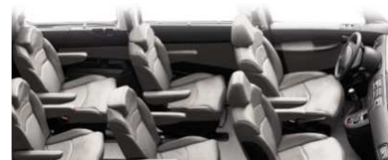
In der „Pullman“-Konfiguration (sechs Sitze) wird durch den fehlenden mittleren Sitz mehr Platz geschaffen. Alle Sitze sind mit Armlehnen ausgestattet. Die hier dargestellte Version verfügt über Ledersitze.

***Serienmäßig für die Vordertüren und ab Modell Tendance für die hinteren Türen.