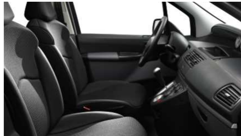
Polster: Stoff Starting Grau