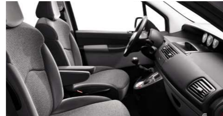
Polster: Stoff/Velours Fangorn Grau