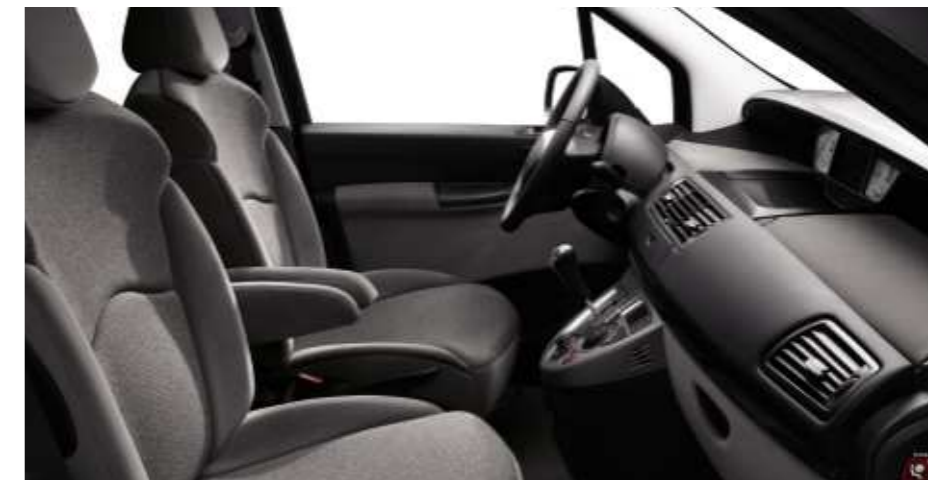
Polster: Stoff/Velours Fangorn Matinal