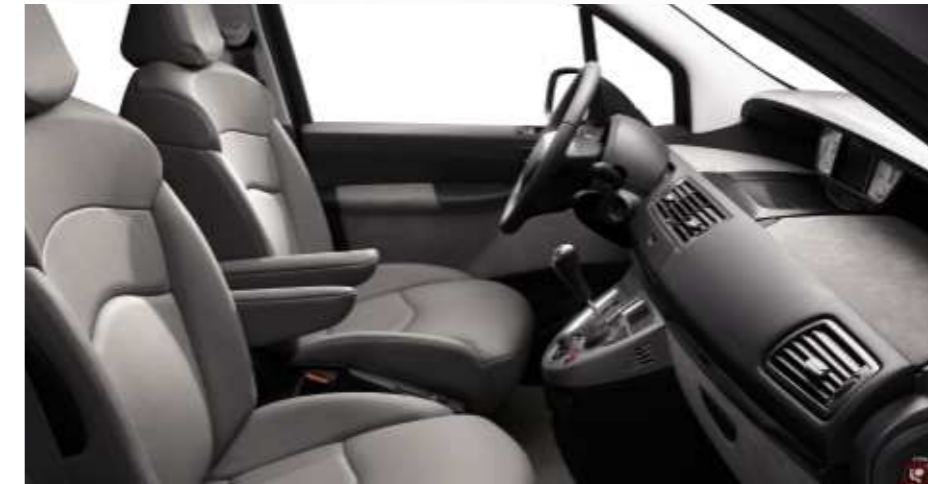
Polster: Leder* Matinal Grau