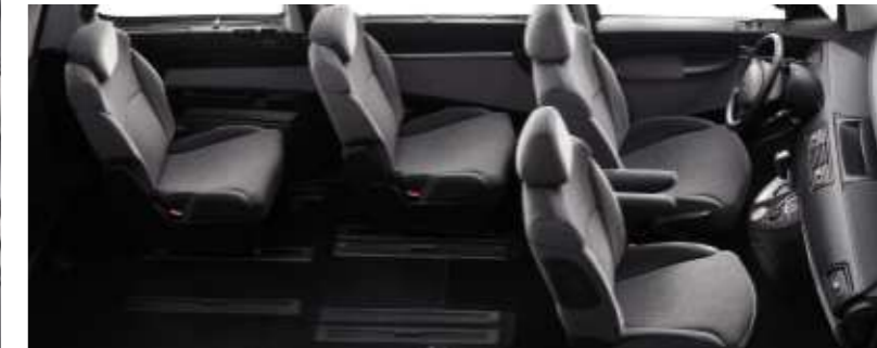
Von besonderem Wert erweist sich eine solche Konfiguration dann, wenn es darum geht, den zum Transport besonders sperriger Gegenstände benötigten Stauraum zu schaffen.