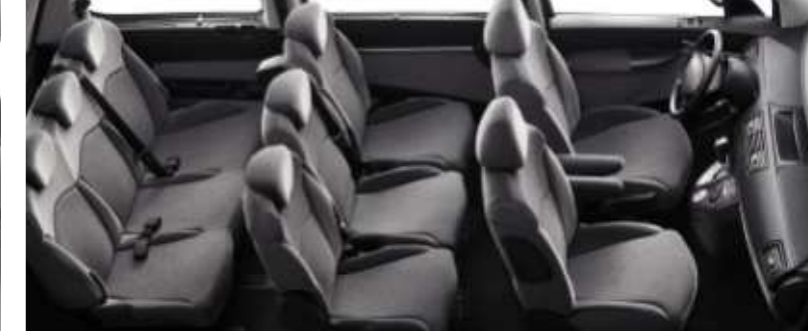
Mit der Großraumlimousine PEUGEOT 807 befördern Sie sehr bequem bis zu acht Personen. Die optionale 3. Sitzreihe kann durch eine Sitzbank ersetzt werden.