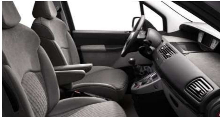
Polster: Stoff/Alcantara Matinal Grau