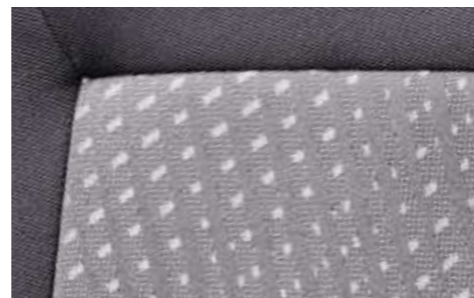
Poster: Stoff Marie Bursa