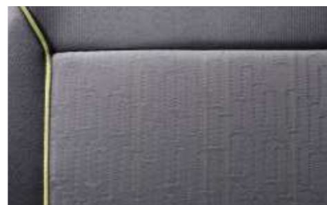
Polster: Stoff Trip