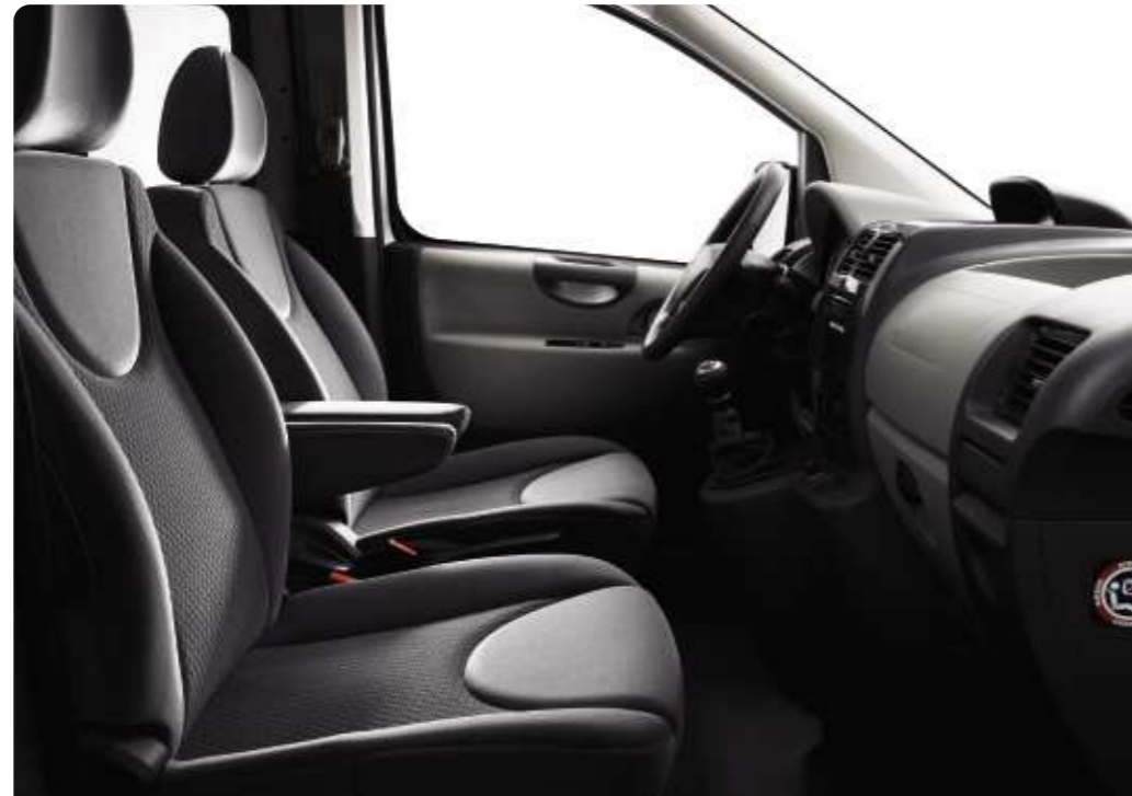
Polster: Velours Jocaste Dunkelgrau