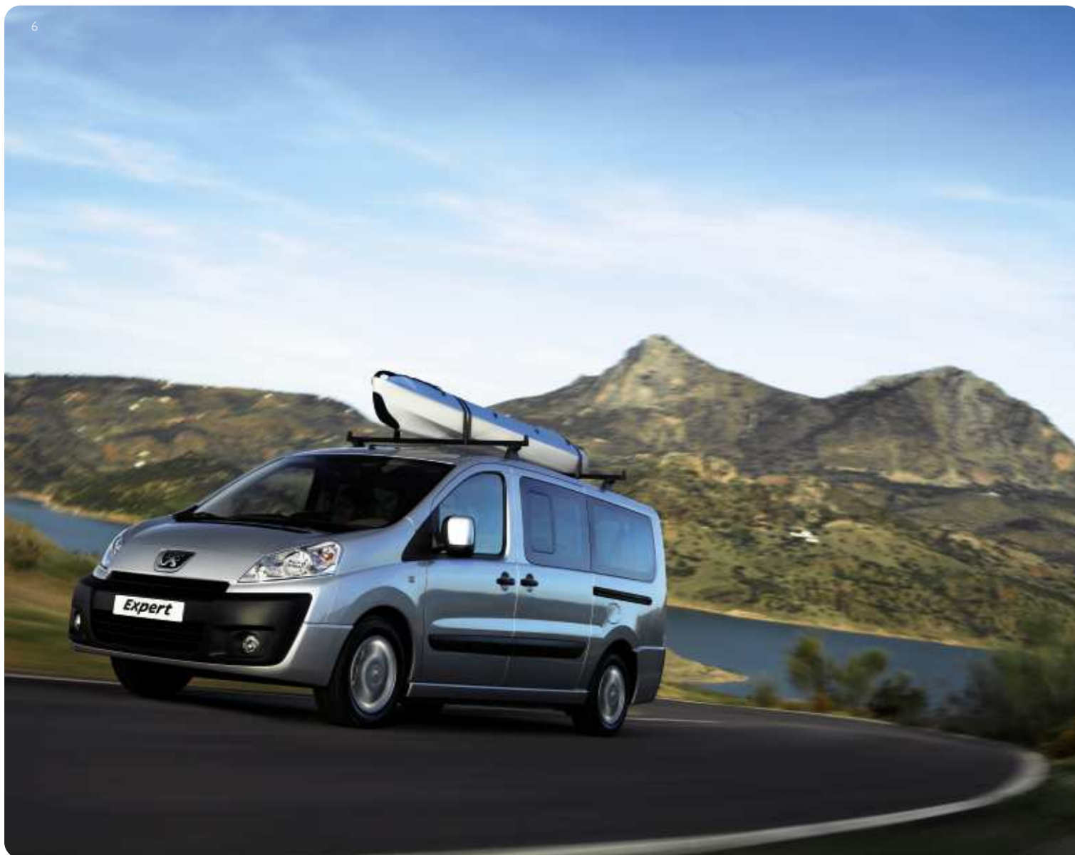
Abbildung enthält Zubehöerausstattung.