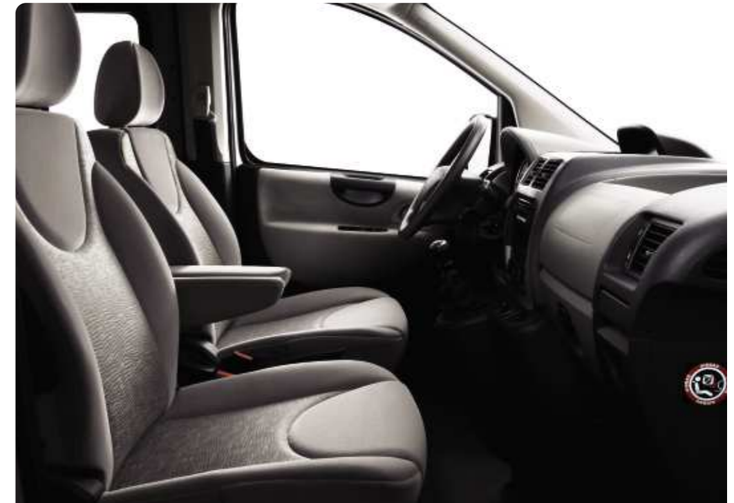
Polster: Stoff Mikado Graubeige