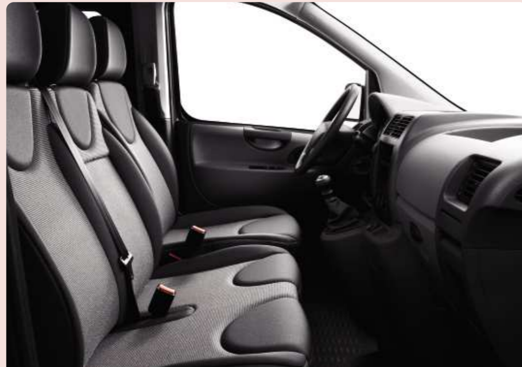
Polster: Stoff Transcodage Anthrazit