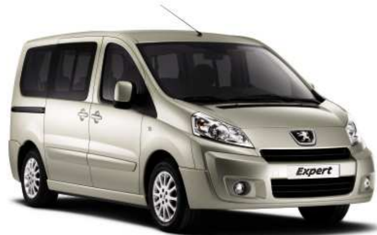
Abbildung mit Sonderausstattung Leichtmetallfelgen.