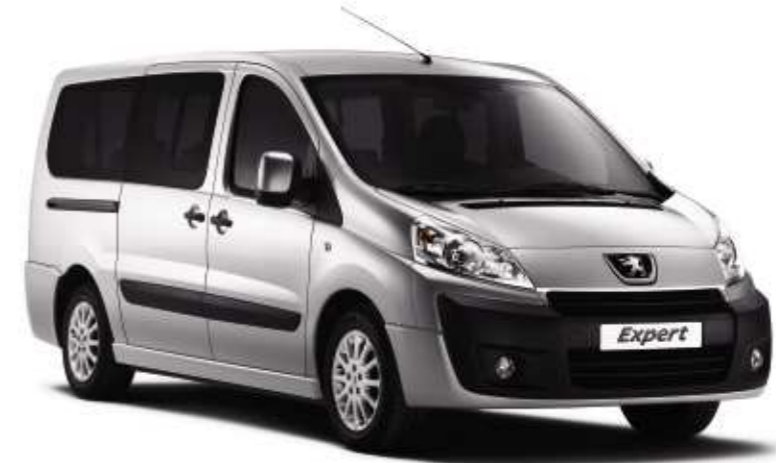
Abbildung mit Sonderausstattung Leichtmetallfelgen.