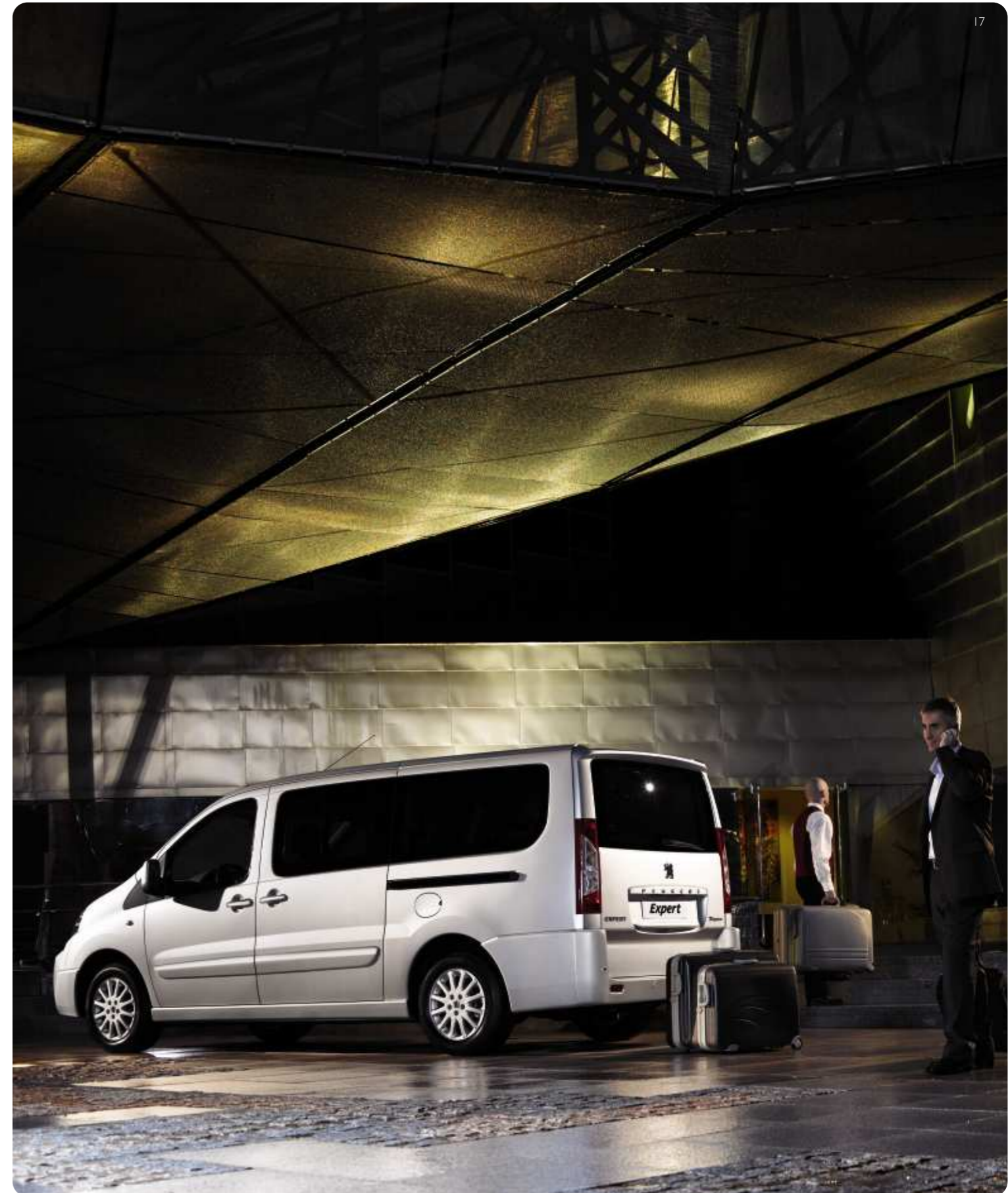
Abbildung mit Sonderausstattung Leichtmetallfelgen.