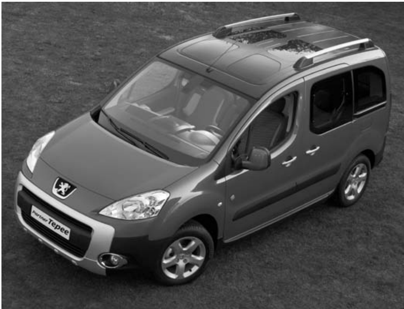
Abbildung: Partner Tepee Outdoor mit Sonderausstattungen.